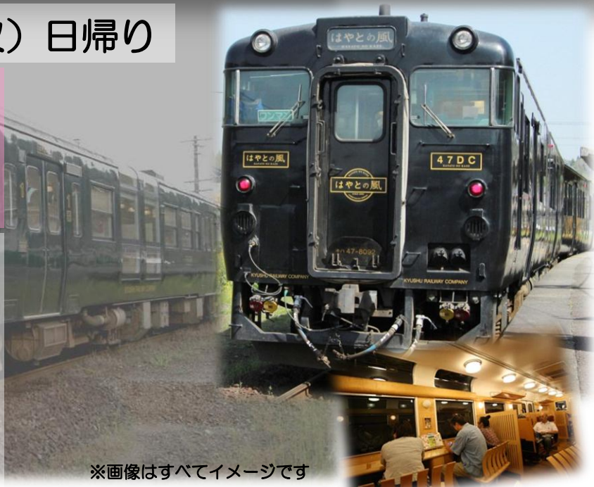
※画像はすべてイメージです